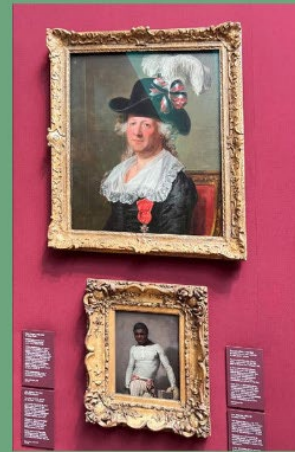
Neugestaltung der Hängung, um die Vielfalt der Sammlung hervorzuheben

Auch die Vermittlung in den Galerien trägt zu unserer Vision bei. Die Werktexte erläutern nicht nur den Kontext der ausgestellten Personen, sondern vor allem auch deren Beitrag zur britischen Geschichte und Kultur . In vielen Räumen wurde dies durch Audio-, Video- und digitale Technologien erweitert, um ein tieferes, partizipativeres Erlebnis für alle Interessensgruppen zu bieten, einschließlich Film, interaktive Elemente und Ton. Die National Portrait Gallery hat dafür mit Bloomberg Philanthropies zusammengearbeitet, um exklusive Inhalte für die Bloomberg Connects App zu entwickeln, die über Smartphones zugänglich sind.