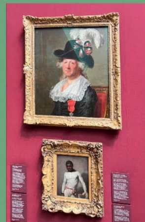
Rearrangements to emphasise the diversity of the collection